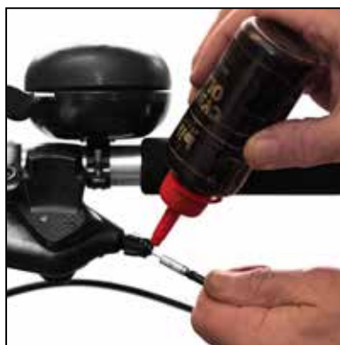
Gearkablet smøres med olie i begge ender Se også billedet på næste side