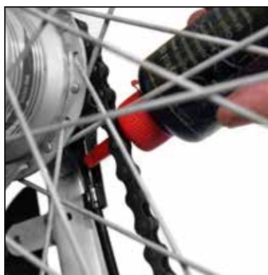
De bevægelige dele på højre side af bagnarvet smøres med olie