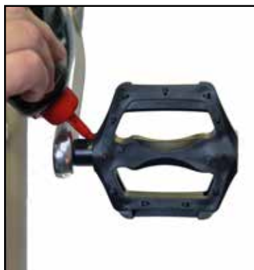
Pedalerne: Smøres med olie