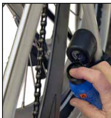
Låse: Smøres med låsespray. Brug ikke olie.

Diverse skruer, bolte og samlinger: For at forhindre korrosion, er det en god ide at holde disse indfedtede med olie eller konsistensfedt. Brug evt en lille pensel, og tør det overskydende bort med en klud.