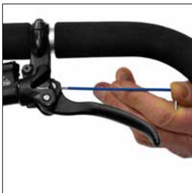
Parkeringsbremsen justeres med en 2mm Unbraconøgle

Hydrauliske bremses: Bremserne er selvjusterende. Hvis forbremserne bremses skævt, er det fordi der er kommet snavs eller olie på den bremseskive, der bremses svagest. Bremseskiven rengøres med sprit eller rensbenzin. Husk: Bremserne må aldrig smøres.